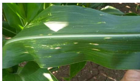
Danys en fulla per adults

El Departament d'Agricultura, Ramaderia, Pesca, Alimentació i Medi Natural de la Generalitat de Catalunya va publicar la fitxa 73 Diabrotica virgifera (actualitzat oct-2017).