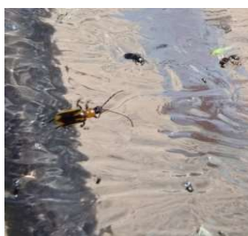
Adult en trampa engomada

A meitat del mes de juny vam trobar les primeres captures i danys als termes municipals de Castellnou de Seana, Ivars d'Urgell, Linyola i Vila-Sana entre altres.