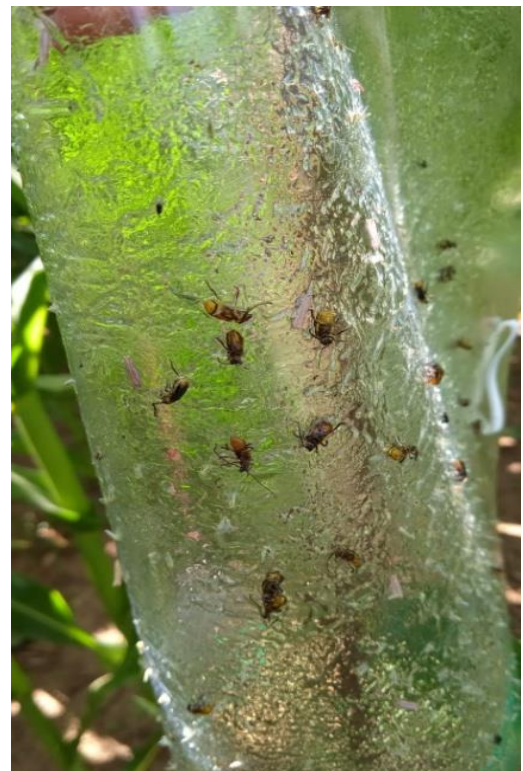
Adult en trampa de feromona