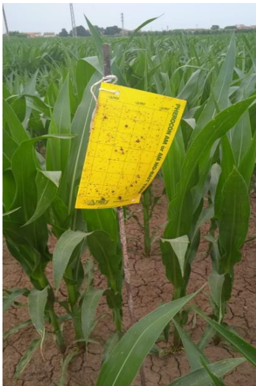
Trampa cromàtica