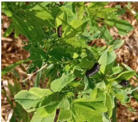
Eruga negra ( Colaspiderma barbarum )

Després de la primera sega podem trobar eruga negra, pugó verd i morrut.